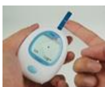
GOTA DE SANGUE