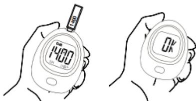
INTRODUZINDO A VERIFICANDO NÚMERO DO TIRA CÓDIGO LEITOR